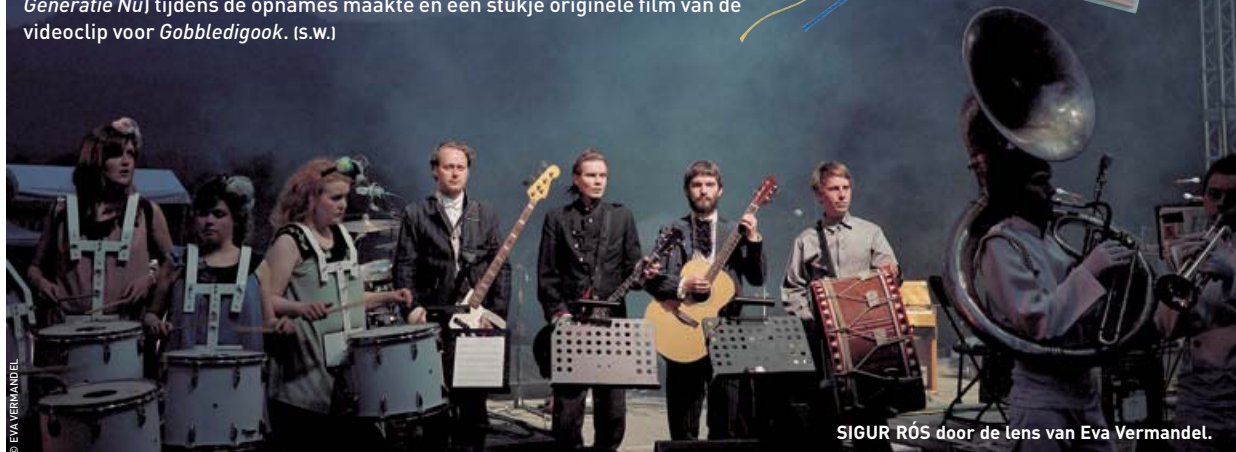
SIGUR RÓS door de lens van Eva Vermandel.

Enkele maanden nadat hun nieuwste album in de winkels kwam, brengen de IJslanders van Sigur Rós een luxe-editie uit. En daarvoor gaat de groep all the way . Naast de cd en een dvd met tourbeelden en opnames uit het repetitiehok, krijg je ook een tweehonderd pagina's tellend fotoboek. Daarin vind je beelden die de Belgische fotografe Eva Vermandel (zie ook onze zomerreeks Generatie Nu ) tijdens de opnames maakte én een stukje originele film van de videoclip voor Gobbledigook . (s.w.)